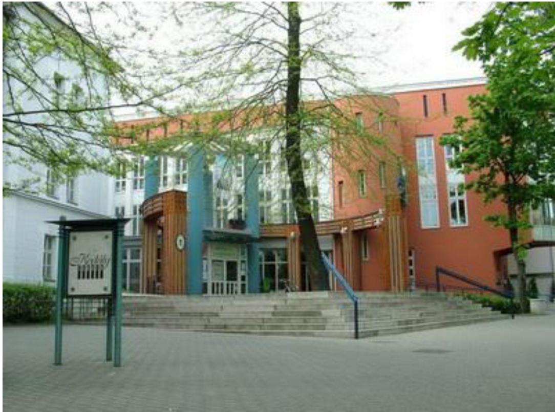
Kecskeméti Kodály Zoltán Ének-zenei Általános Iskola, Gimnázium, Szakgimnázium és Alapfokú Művészeti Iskola